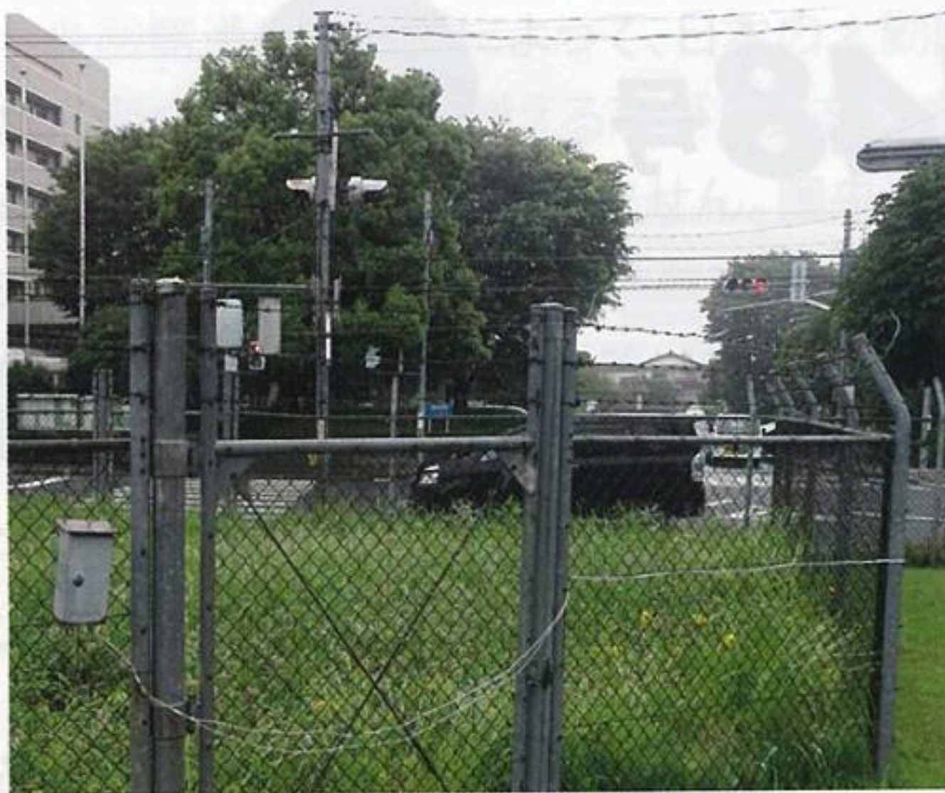
入間基地内から見た狭山市役所前のゲート

この事は以前より、市内商店街の方からの強い要望がありました。「入間基地のゲート(出入口)を狭山市役所前に作ってくれば、自衛隊員が、狭山市に住んでくれたり、食事してくれたりする人も増えるので、ぜひお願いしたい」との事でした。そして今年ようやく、市役所前のゲートが使われる事となりました。