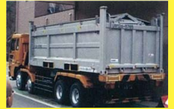
コンテナは密閉されたまま焼却場へ

埼玉県は、更なる安心・安全の為、被災地や受入れ段階で細かく11段階で放射性物質濃度を測定し、安全なものだけしか受け入れません。なお、福島県内の震災がれきは、国が同県内で処理するので、埼玉県が引き受ける事はありません。がれきは、被災地で細かく分別され、木くずを細かくチップ化して、フタ付のコンテナに入れ、県内まで鉄道で輸送し、コンテナのままトラックで焼却場に搬入します。