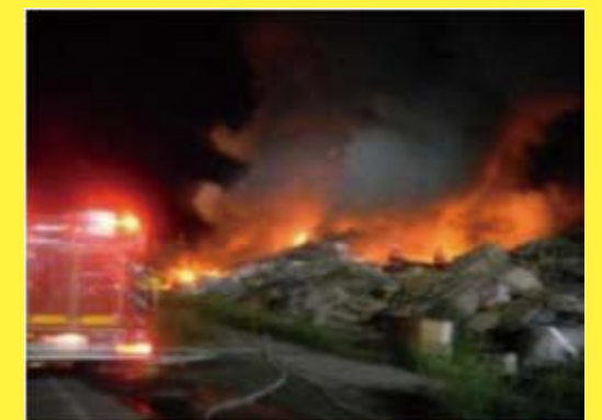
岩手県（写真左）・宮城県の仮置場での火災発生状況

被災地のがれきが処理出来ずにいる為、乾燥・発酵等により火災や、腐敗して生活衛生上も問題が出て来ていると、被災地の議員から聞きました。